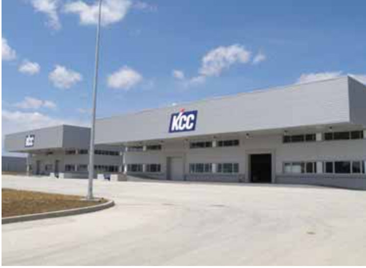
KCC BOYA FAB. GEBZE